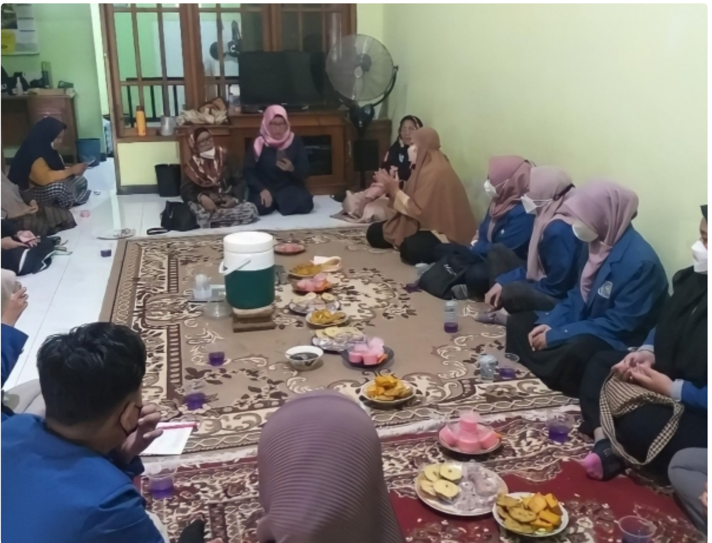
Kegiatan pendampingan dan transfer ilmu oleh tim KKN Abmas ITS kepada UMKM setempat

SURABAYA – Harga minyak goreng yang tengah membumbung tinggi di pasaran membuat sebagian pejuang ekonomi keluarga merasa terhimpit dan kewalahan. Berangkat dari permasalahan tersebut, tim Kuliah Kerja Nyata dan Pengabdian Masyarakat (KKN Abmas) Institut Teknologi Sepuluh Nopember (ITS) melakukan sosialisasi hingga pendampingan tentang proses penjernihan minyak bagi pelaku Usaha Kecil Mikro Menengah (UMKM) di Kelurahan Keputih,